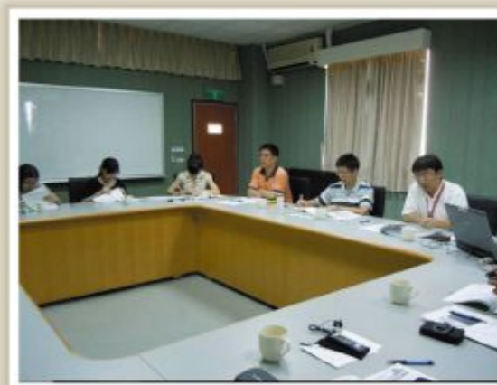
▲圖四、至虎尾科技大學辦理情形1