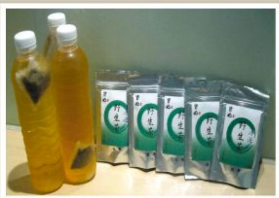
▲ 桃源野生冷泡茶 喝起來具有獨特蜜香

寶山野生茶具有其歷史性、文化性及獨特性，極適合做為地方產業長期發展之特色商品，因此管科會輔導團隊協同業者與專業製茶廠商，針對野生山茶之發展，共同討論並協助開發新商品。透過開拓都會消費新市場，提供消費者快速而便利的選擇，以南台灣高山獨特蜜香的野生冷泡茶，來創造桃源區野生茶的契機，增加寶山野生茶的附加價值，提昇野生茶產業整體產值。