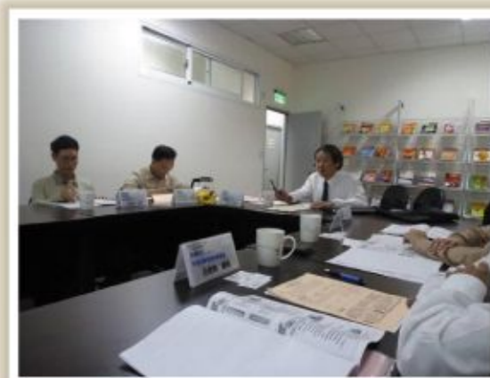
▲圖二、至亞洲大學辦理情形2