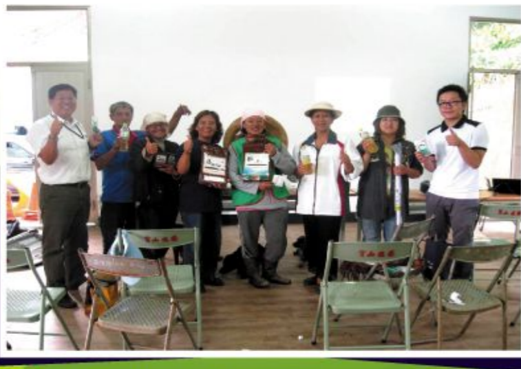
▲ 冷泡茶產品開發讓業者看見未來方向 業者與輔導團隊歡樂合影

茶是世界三大主要飲料之一，世界茶市場正在不斷擴大，無論是茶葉產量，還是每人平均消費量，都在逐步增加。此次管科會輔導團隊協助桃源區野生茶開發之冷泡野生茶包，在市場定位上，以冷泡方便使用的特性，來吸引年輕上班族群，開發新世代的喝茶文化。在合作媒合上，協助桃源區山茶業者與在地公司企業合作商品生產與架接後續銷售通路。相信未來以此方向前進，桃源區野生冷泡茶產業的前景是充滿樂觀及可期待的。