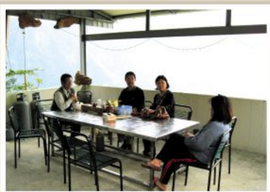
▲ 輔導團隊偕同冷泡茶專業廠商 前往桃源山區了解野生茶特性