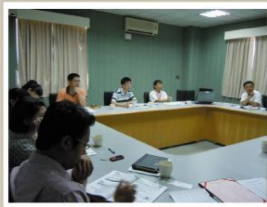
▲圖五、至虎尾科技大學辦理情形2