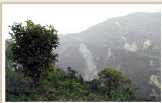
▲ 佇立於南橫山脈 標高1000公尺以上的寶山野生茶樹

社 團法人中華民國管理科學學會為協助地方產業整合凸顯地方特色之產品，並促成地方特色與群聚效應的產業活動，透過輔導團隊進入桃源區，透過與區公所、在地組織逐步評估各項客觀條件後，針對桃源地區具有歷史性、文化性、獨特性之野生茶進行輔導，茲陳述如下：