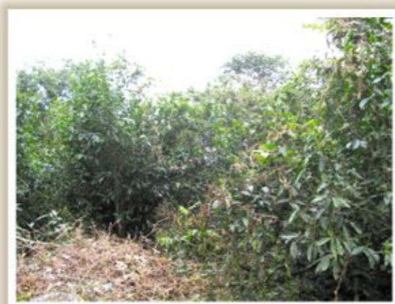
▲ 寶山野生茶樹 採自然農法 不灑農藥

桃源寶山的野生茶傳說由荷蘭人引進台灣後，以景觀樹種栽植，日據時代再以中央山脈南麓各古道為主要種植區域，每年四、五月間，極品茶葉則送進宮殿供奉天皇飲用；然原住民長年對茶樹及茶道等資訊嚴重不足，而視野生茶為樹叢雜木，並未積極整理栽植，直到近幾年來常與漢人接觸並取得茶葉相關資訊後，才開始整理栽植。（資料來源：桃源區公所網頁）