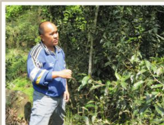
▲ 寶山野生茶樹最高可長到數公尺高