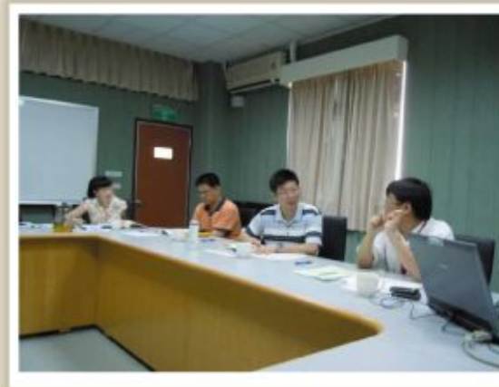
▲圖六、至虎尾科技大學辦理情形3