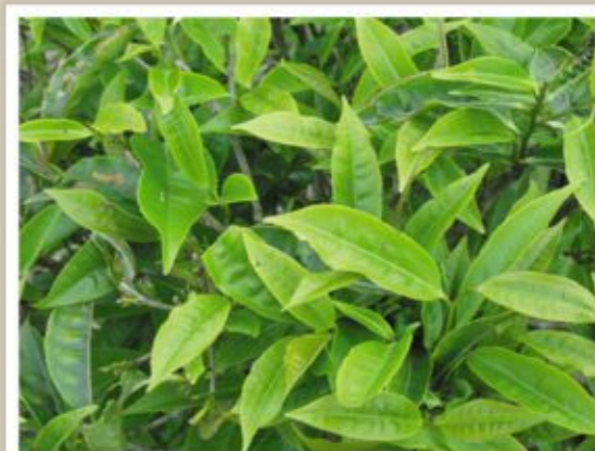
▲ 寶山野生茶 好處多多

台灣的三大怪茶「港口茶」、「佛手茶」、「六龜茶」各有特色，其中六龜茶是玉山山脈「高山茶」產區的延伸，分佈在六龜、甲仙、桃源、茂林一帶，而桃源區公所近年開始推行屬於桃源自產自銷的野生茶，在本質上與三大怪茶中的「六龜茶」相同，兩者均是台灣山區原生種的山茶，喝起來具有獨特的香氣，亦是台灣特殊口味茶之代表。