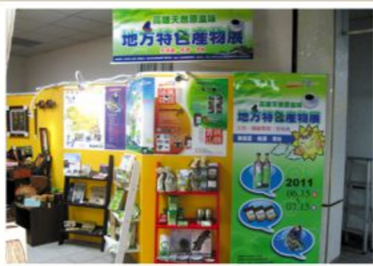
▲ 協助桃源山茶業者產品進駐高捷R9原住民商店