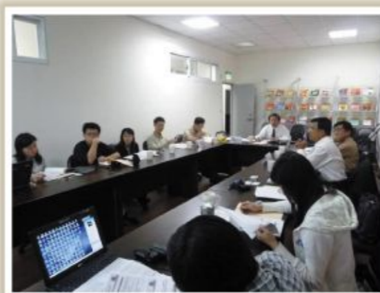
▲圖一、至亞洲大學辦理情形1