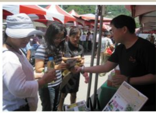
▲ 透過展售會推廣桃源野生冷泡茶

為桃源區具有獨特性之野生茶，開發冷泡茶包新商品後，管科會輔導團隊陸續在展售活動及各行銷通路，協助桃源區野生茶業者及商品與各市區展售通路做結合，讓業者看到野生冷泡茶產業未來發展的方向與商機。