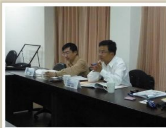
▲圖三、至亞洲大學辦理情形3