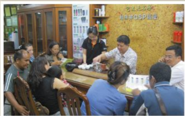
▲ 協同業者於代製廠商處 商談野生冷泡茶長期合作事宜

由於目前桃源山區大部分區域已被列為紅色警戒區，故不適宜設製造工廠在山上進行冷泡茶包加工。因此管科會輔導團隊進一步協助業者與台南地區冷泡茶公司合作生產，並透過代製成本分析說明，讓業者充分了解未來冷泡茶包在市場上銷售利潤的可行性。目前共協助6位野生茶業者與代製廠商合作，共投入近100台斤的野生山茶來進行冷泡茶包的後續製作，讓冷泡茶商品成為桃源區永續發展的地方特色產品。預計產出近6000包的冷泡茶包，透過相關通路販售後，可以創造地方近60萬的產值。