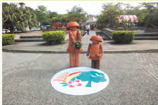
▲特殊盆栽園藝造景