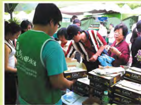
▲鳥松特產-大貝餅試吃現場人潮踴躍