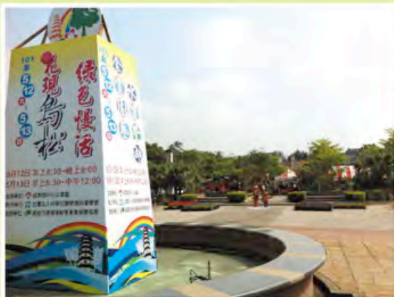
▲花現烏松 綠色慢活活動精神堡壘

透過地方以主題帶動地區、地區帶動產品、產品再推展出新的一番產業的成果，讓地方的人覺得「原來園藝可以結合這麼多週遭創意，怎麼以前都沒想到呢？」，但大家對於這段日子彼此的合作與努力，都表示認同。有了在地組織的推動，相信在未来的日子裡，烏松區會帶給遊客有別以往不同的旅遊感動。