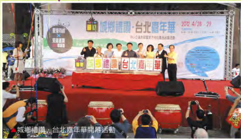
▲城鄉禮讚·台北嘉年華開幕活動