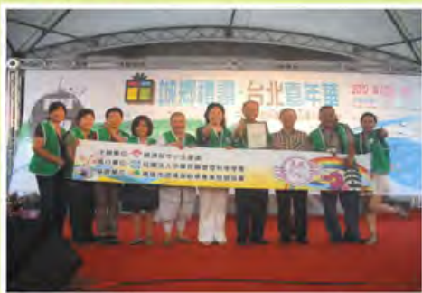
▲鳥松區榮獲城鄉禮讚創意攤位競賽綠區冠軍

多家，為年度最大的地方特色商品聯合展售會。本次活動中，管科會協助以地產基金南區服務團與中小企業互助合作輔導計畫中，高雄、嘉義、屏東、台南等地方特色業者參與本次活動。其中高雄市之鳥松區「食賞園藝 水遊澄湖」計畫，透過管科會輔導之在地組織澄清湖創意商業發展協會，佈置園藝主題創意展區，與推廣地方園藝特色商品，最後本次活動榮獲「城鄉禮讚創意攤位競賽」綠區冠軍，成功提高鳥松地區地方特色園藝產業的曝光！