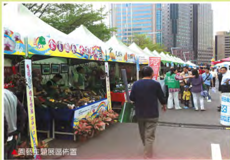
▲園藝主題展區佈置

本活動透過管科會輔導結合並凸顯鳥松地方特色產業，以食賞園藝-配合以地方特色商品「大貝餅」與特殊園藝造景，來帶動水遊澄湖-澄清湖周遭特色園藝業者的發展。巧妙運用當地景觀及特色元素靈感，協助當地園藝產業塑造主題意象，將鳥松區具地方特色代表的園藝產業有效推廣帶動。