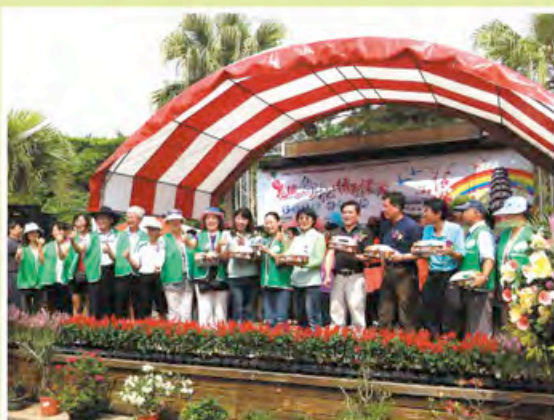
▲活動 獲得地方立委與中小企業處長官的肯定