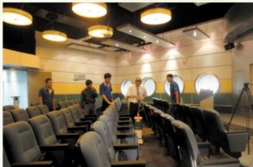
▲樂活居聯盟受大公司白蘭氏的青睞，承接觀光工廠專業清潔作業。