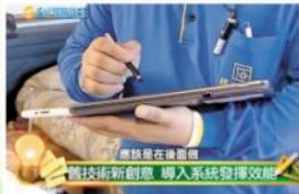
▲清潔專家手持平板電腦，現場健診居家環境問題。

「樂活的居住環境」不只是一項口號或目標，具有高度熱忱的樂活居聯盟以實際行動，將完善的清潔服務推廣給更多人，自同時傳達正確環保知識，共同創造優質的生活環境，開創充滿健康、舒適、快樂的居家生活空間。