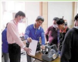
▲員工的專業養成，一直是樂活居聯盟所重視的。