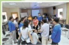
▲拋開傳統的框架，員工也能自我探索，學到了專業也學到了態度。

另外，樂活居聯盟會請合作的夥伴，來上課，讓員工能對清潔業務有基本的認知與了解。比如說修補專業，服務修補的廠商會來教修補的基本操作與流程。但員工不需要學到專精，只要對流程以及基本概念有輪廓邏輯的建立即可。日後，若在第一線服務顧客時，一旦遇到顧客詢問起其他專業服務時，便可以給予顧客即時回應，讓顧客了解流程、基本概念，因此也賦予了新的額外附加價值，與新業務的開發。